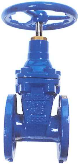
Fig. 023 / 55 PN25 ACS