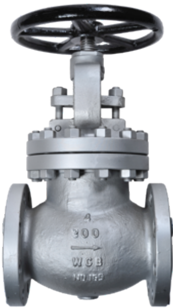
Fig. 132 / 240 PN100 ASA 600 lbs