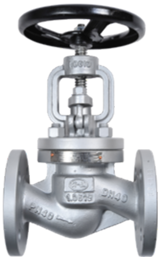
Fig. 121 / 225 PN40