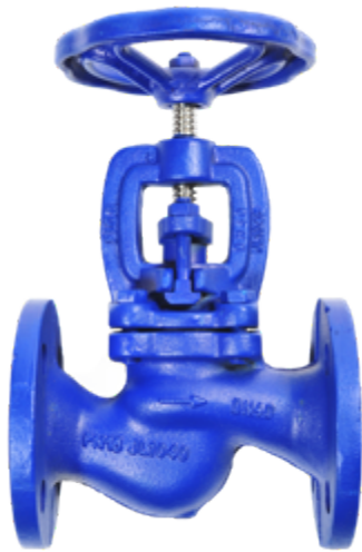
Fig. 105 / 212 PN16