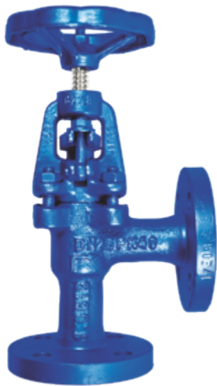
Fig. 104 / 211 PN16