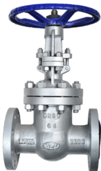
Fig. 035 / 79 PN63