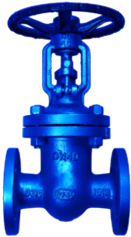
Fig. 032 / 75 PN25 ACS