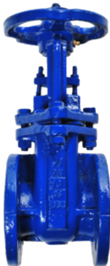
Fig. 012 / 30 PN 16