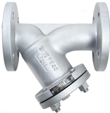
Fig. 351/545 PN40