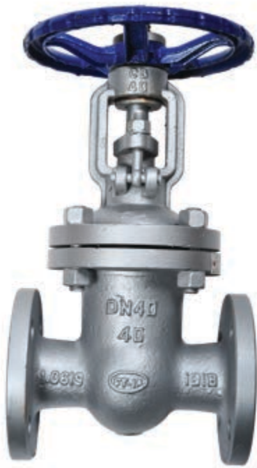
Fig. 033 / 78 PN40